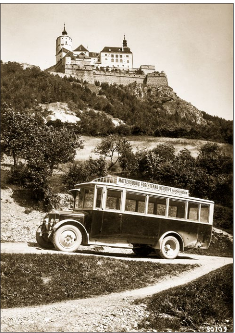
Autóbusz a fraknói vár alatt, 1930

A legnagyobb és egyben a legsürgetőbb feladat Márki-Zay számára nem az európai