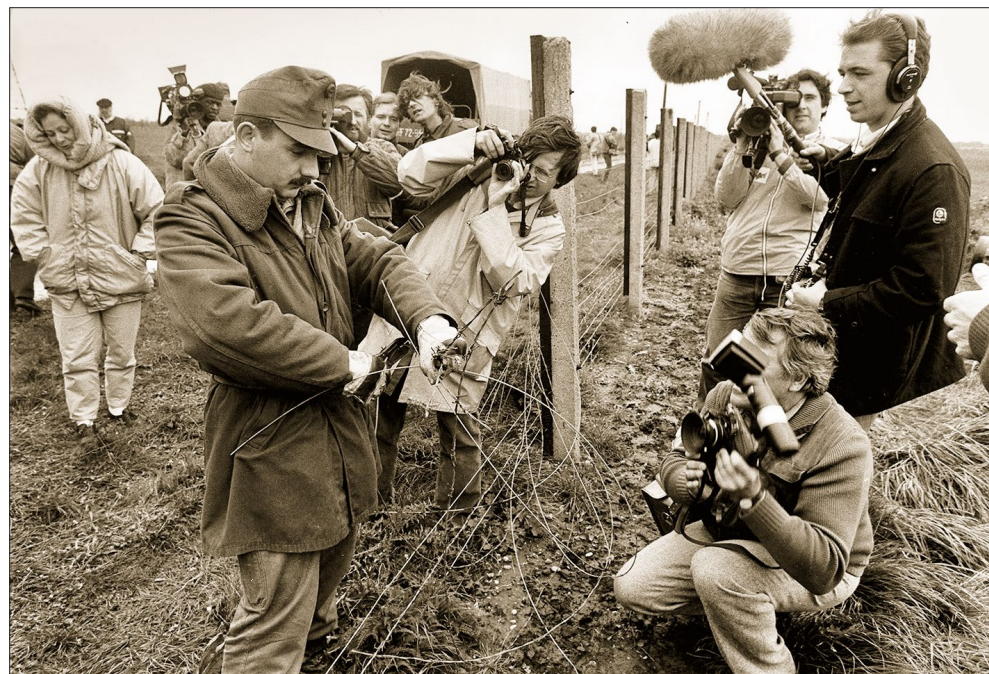
A vasfüggöny lebontása Hegyeshalomnál, 1989. május 2.