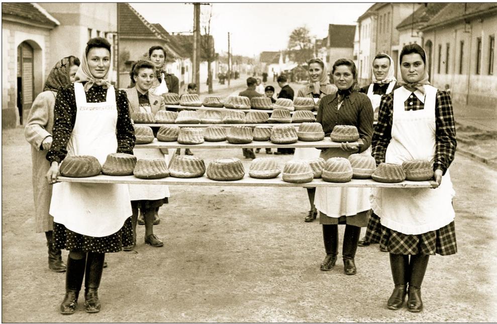
Lányok, asszonyok 150 lakodalmi kuglófjal, Fertőmegyes, 1950