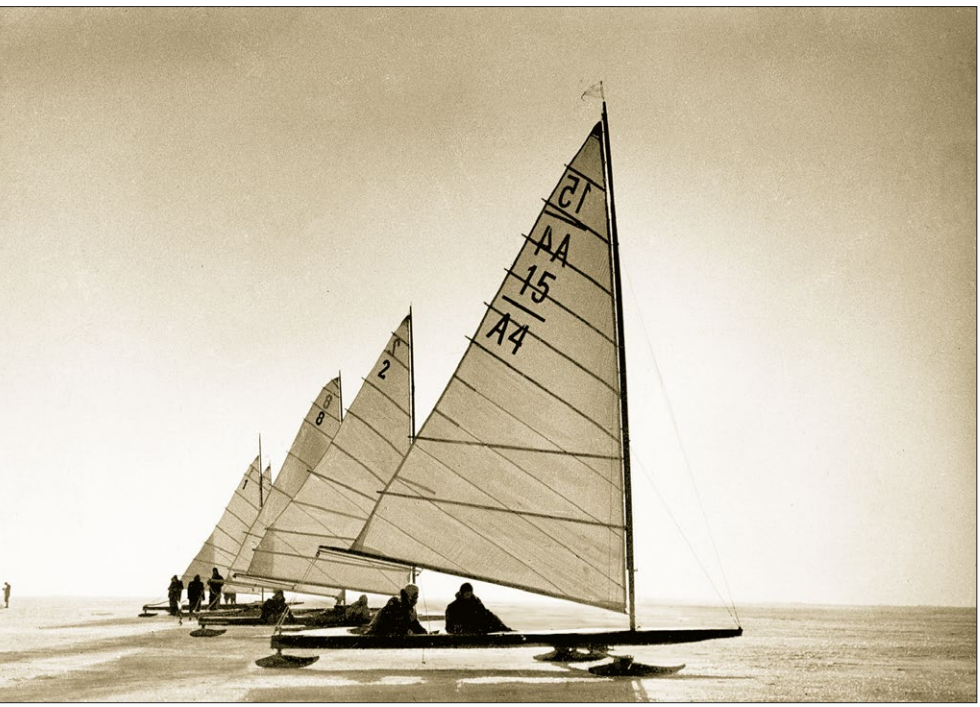
Jégvitorlások a Fertőtön, 1938 előtt

A levelekből az is láthatóvá válik, hogyan oldódott egyre inkább Faludy kezdeti tartózkodása, miként áradt el mind jobban a címzett személye felé iránuló feltétlen bizalom. Kezdetben még rövidbűb, főként teendőiről, aktuális publikációiról, előadásairól szóló tudósításokat küld, a 4. levélről (1983) azonban már a későbbi roppant vállalás, a Tast és lélek versátültetéseit és saját újabb költeményeit is megosztja. A világlíra szubjektív keresztmetszetét adó, mintegy 1400 fordítás