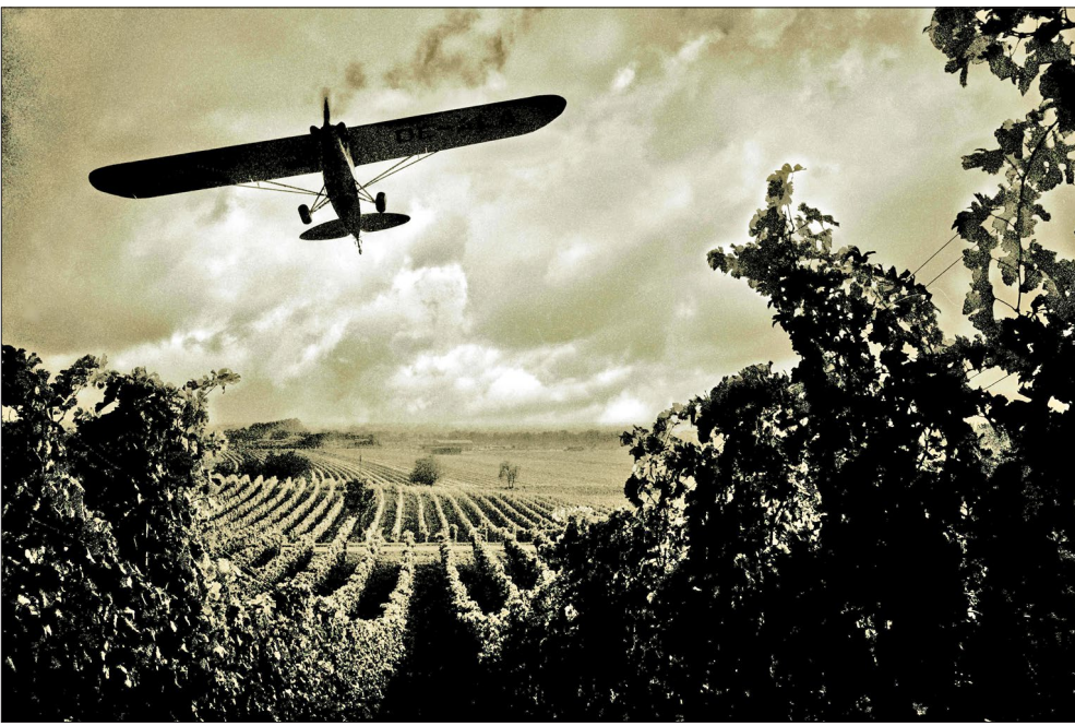
Seregélyriasztó repülő, Gálos, 2011

1989. október 23-ának tovatűnő emléke-zete mellett érdekes volt megélni 2006. ok-tóber 23-a idei hangulatos megjelen(ít)ését. Az ötvenedik évforduló mezején, szeptember-október során zajló meglehetősen bonyolult és sok szálant fuító eseménysorozatot mozi-és dokumentumfilm, múzeumi fotókiállítás idézte meg, de az Astoriánál bejátszott rövid felvételek, a gumilőtérdő jellegzetes hangjai vagy a „SZABADSÁG” újra felállított betűi szintén a tizenöt évvel ezelőt történetnek emlékeztettek. A magam – a rendszerválta-s éveiben születettek – nemzedéke értelemsze-ven a fordulatról nem írízhet igaz, eleven emlékeket – 2006-ról azonban már annál in-kább. Láttuk, amit láttunk, és hallottuk, amit hallottunk – és sok mindener emlékezünk. A „hazudtunk reggel, éjjel meg este” már-már ’56-os nosztalgijáára, a Kossuth téri békés „Hyde Parkra”, a Szabadság téri tv-székház ostromának megmagyarázhatatlanságára, az